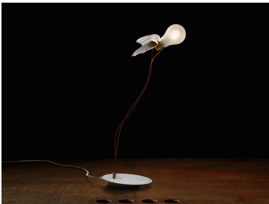
Lucellino Table INGO MAURER 1992 / 2022

Lucellino Table ist die Tischleuchte aus der Ingo Maurer-Klassiker-Serie Lucellino. Die Glühbirne mit Flügeln schwebt über dem Tisch und zieht die Blicke auf sich! Neu ist das Ambient-LED-Leuchtmittel. Es wurden speziell für die Lucellino-Serie entwickelt, um ein LED-Leuchtmittel zu erhalten, das der Halogen-Glühbirne noch näher kommt. Es verbindet die Vorteile der LED-Technik mit den Stärken der Glühlampe. Es bietet die Effizienz einer LED und gleichzeitig die Lichtqualität und das Dimmverhalten einer Halogenbirne. Die matte Ambient-LED-Birne wird mit einer Spannung von 12 Volt betrieben und erzeugt in Verbindung mit dem im transparenten Kabel verbauten LED-Netzteil mit Schieberegler ein angenehmes, warmes Licht. Die Leuchtmittel werden exklusiv für die Ingo Maurer GmbH hergestellt und mit dem angelötetem roten Kabel versehen. Material: Handgefertigte Flügel aus Gänsefedern, Glas, Messing, Kunststoff